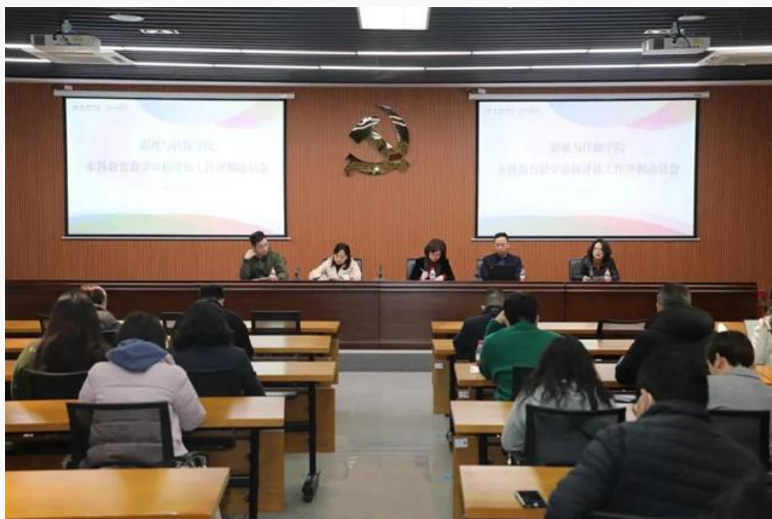
本科教育教学审核评估工作冲刺动员会现场

2月25日下午，影视与传媒学院在南湖校区漓江画派楼101会议室召开本科教育教学审核评估工作冲刺动员会，学院领导班子成员、全体教职工参加会议。