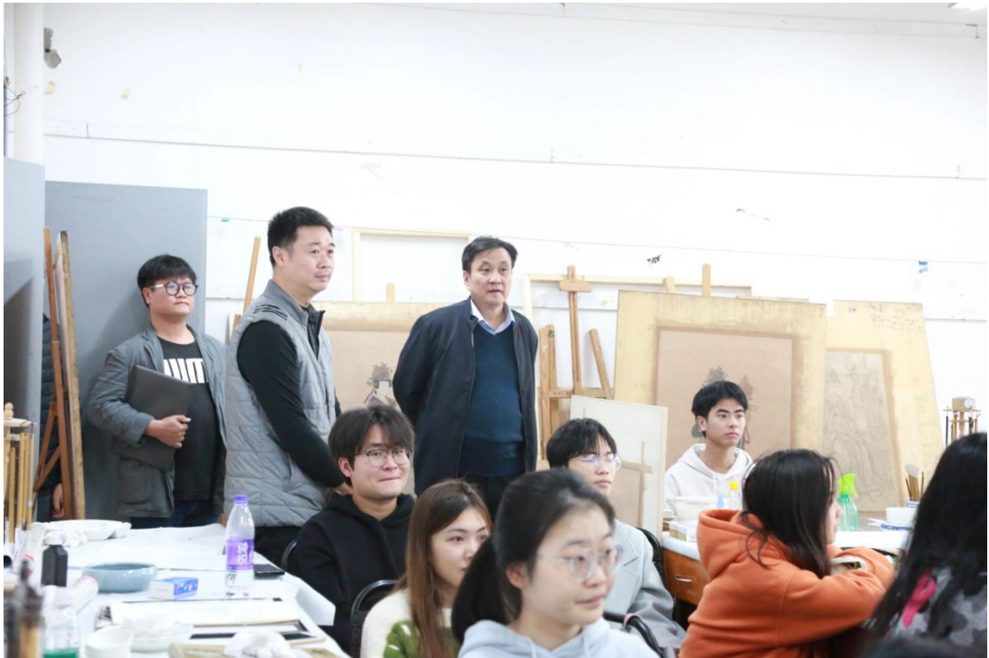
校领导同我院领导视察本科教学课堂

通过此次调研，我院将进一步扎实开展本科教育教学审核评估工作，查摆问题，建立自我评价、自我提高、自我完善的长效工作机制和质量保障体系，以最好成绩迎接审核评估，推动学院高质量发展。