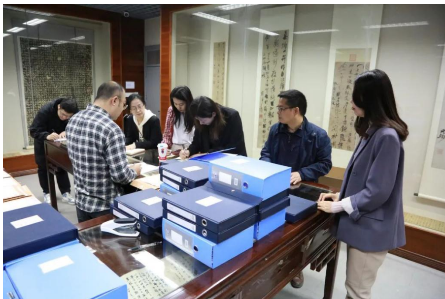
调研组对我院存档材料进行抽检

为给我院教育教学审核评估工作提供更具针对性的整改意见和建议，调研组先进行了对我院存档材料进行抽检，针对抽检中发现的问题进行了督导修正，并在座谈中就相关内容做具体说明，随后深入本科教学课堂进行现场督察和指导。