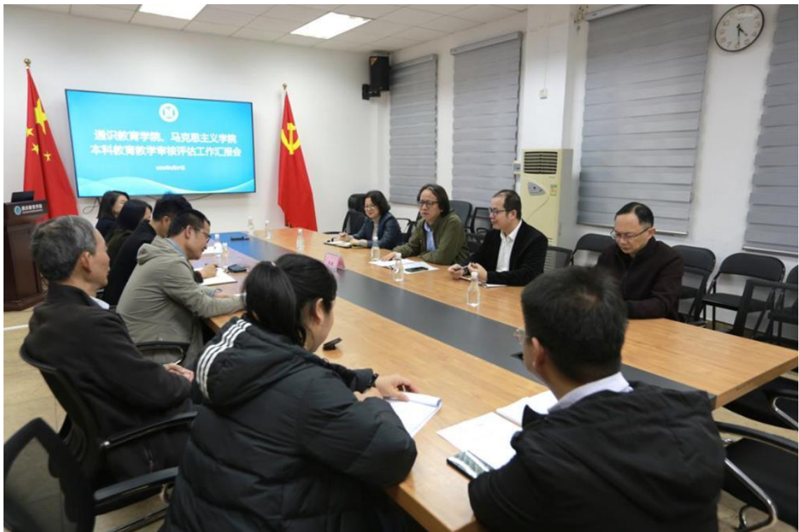
党委常委、副校长伏虎听取教学单位汇报