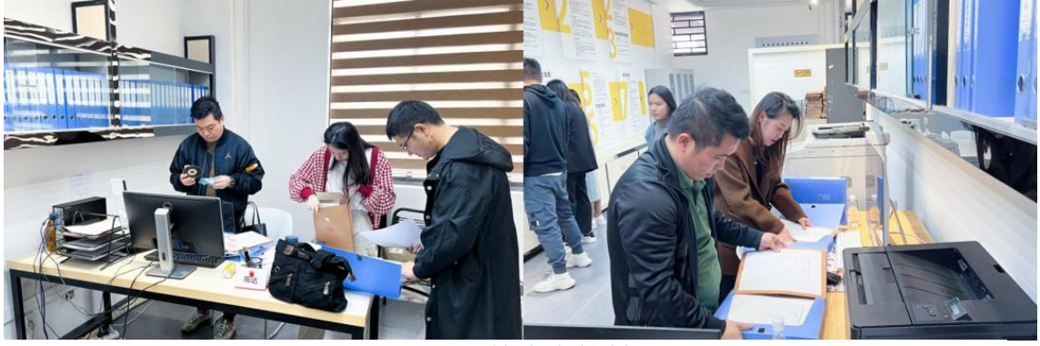
△ 调研组检查存档材料现场